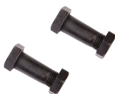
T 6009-450 C Parafuso Cabeça Corta-varões 450 m / T6009450C