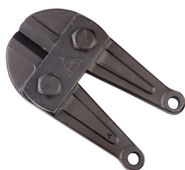
C 6009-450 Cabeça Corta-varões 450 mm / C6009450