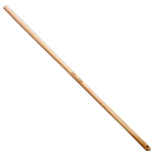
M 901 LC 135

Manche en bois avec certificat pour fourche 901 / M 901 AC 75