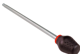
PROSNAPHANDLE Mango sufridera Pro / PROSNAPHANDLE