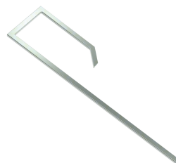
PROGUIDESCR Tornillo tope regla Pro / PROGUIDESCR