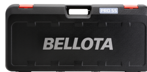
PROPCASE Maleta de plástico para cortadora cerámica / PROPCASE