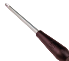
POPHANDLE Mango portaherramientas Pop / POPHANDLE