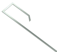
PROGUIDESQU Guia escuadra Pro / PROGUIDESQU